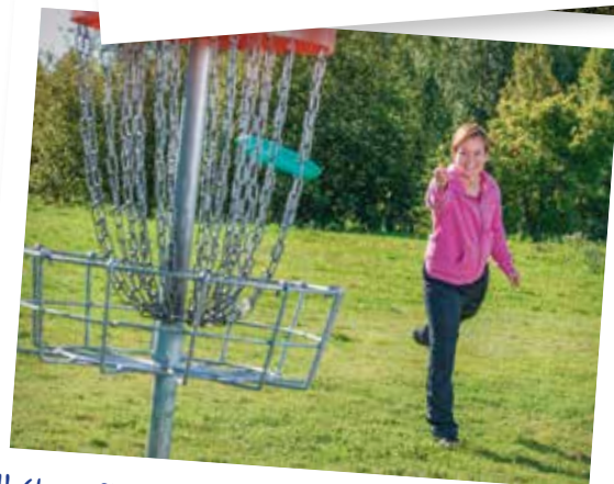
Hrát se může s disky různých velikostí a hmotností

Společnost PASSERINVEST pro sportovní vyžití připravila hned tři parky: Baarův park Park Brumlovka Park na Roztylech