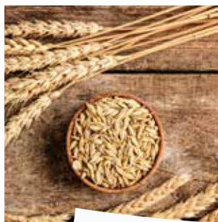
Sirup z ječného sladu