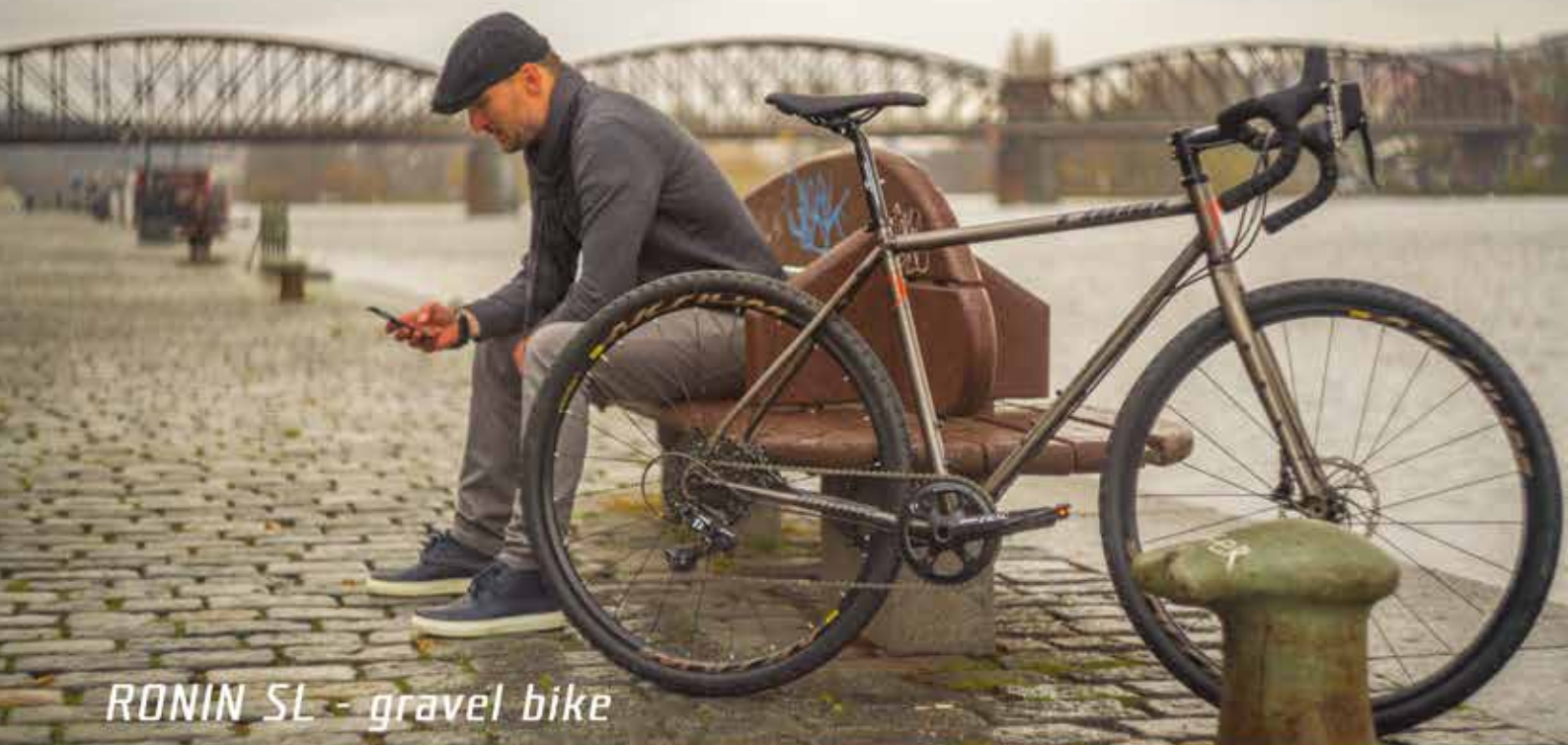
RONIN SL - gravel bike