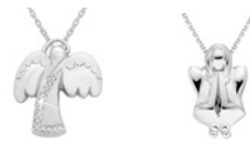
KTERÁ JE ANDĚLEM