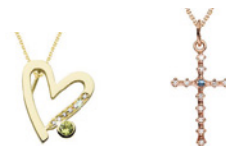
KTERÁ JE PŘÍSTAVEM LÁSKY, VÍRY A NADĚJE