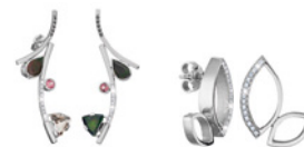
KTERÁ JE ODVÁŽNÁ A KRÁSÁ